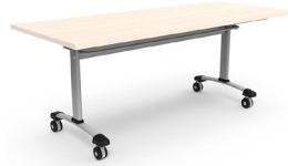
Michigan 180x75x75 SKU: AU31