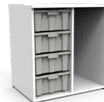
Gavetero Tidy 4 cajas grandes SKU: AX18