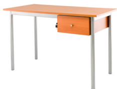
Escritorio 1 cajón SKU: AA29