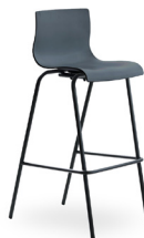
Cob SKU: PC14