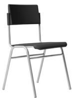
Ergosilla Mineduc Poli Tipo 5 SKU: AA76