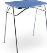
Polipropileno Mineduc Tipo 5 SKU: AA67