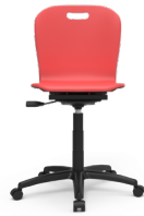
Class Giratoria SKU: AR82