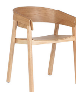
Monterosso Cód.: AU43