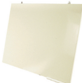
Pizarrón canto aluminio 120x80 cms. Cód: AA90 180x100 cms. Cód: AA92 240x120 cms. Cód: AA94