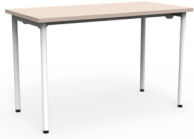
Mesa Link fija 120x60x75 SKU: AV57 150x75x75 SKU: AV58 180x75x75 SKU: AV59