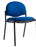
Confort tapizada sin brazos SKU: AB99