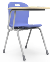
Class paleta Estándar SKU: AP28