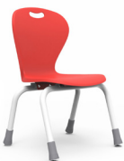
Kidy SKU: AQ81