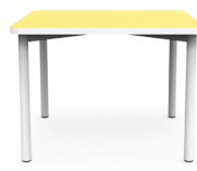
Pipe Small SKU: AW04