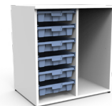
Gavetero Tidy 6 cajas estándar SKU: AX17