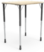
Telescópico cubierta superior SKU: AE35