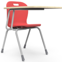
Class paleta King SKU: AP68