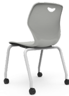
Pieza Movi SKU: AW18