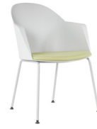
Potenza SKU: AV56