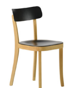
Bari SKU: PC06