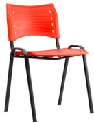
Iso Smart polipropileno SKU: AD50