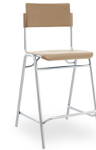
Ergosilla Cajera 65 cms SKU: AA80