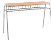
Formalita Estándar bipersonal N° 1 SKU: AA16