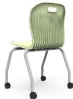
Class Movi SKU: AS60