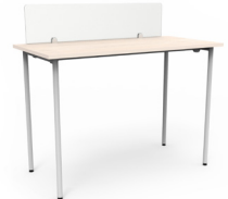
Mesa Link fija alta con separador de vidrio 120x60x105 SKU: AV77 150x75x105 SKU: AV78 180x75x105 SKU: AV79