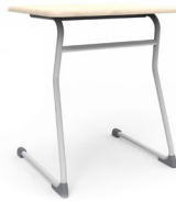
Summa Tipo 5 SKU: AW54