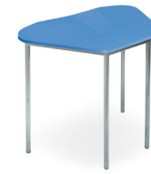
Trapezoidal MDF Tipo 5 SKU: AU27