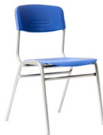
Isonorma Poli Mineduc Tipo 5 SKU: AA73