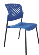
Alice polipropileno SKU: AU88