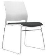
Vittoria asiento tapiz SKU: AV55