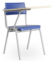
Ergosilla paleta King SKU: AV50