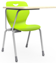
Pienza paleta King SKU: AW23