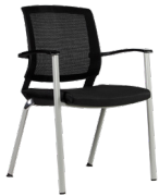
Andria SKU: AW44