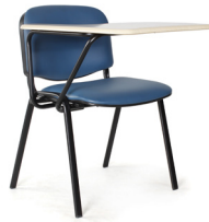
Isósceles paleta King SKU: A108