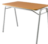
Mesa Profesor Mineduc Sin parrilla SKU: AA66