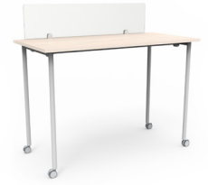
Mesa Link rodante alta con separador de vidrio 120x60x105 SKU: AV89 150x75x105 SKU: AV90 180x75x105 SKU: AV91