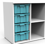
Gavetero Tidy 4 cajas grandes 1 repisa SKU: AX15