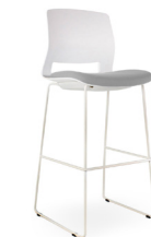
Berna SKU: AP92