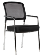
Skill SKU: AV45