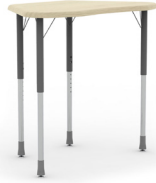
Trapezoidal Telescópico SKU: AE19