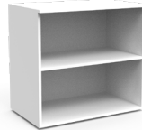
Gabinete abierto SKU: AW94