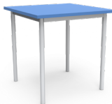
Mesa LP 75x75x75cms Esq. Rectas SKU: AP14 Esq. Redondeadas SKU: AP15 120x75x75cms Esq. Rectas SKU: AP16 Esq. Redondeadas SKU: AP17