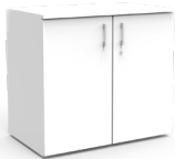
Gabinete 2 puertas Cód: PC48BL