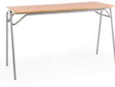
Formalita Mineduc bipersonal Tipo 5 SKU: AA56