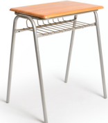
Moldeado Supremo N° 1 SKU: AP87