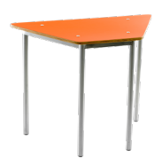
Trapezoidal formalita SKU: AB06