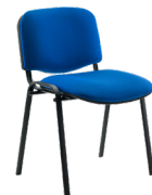
Isósceles tapizada SKU: AB64