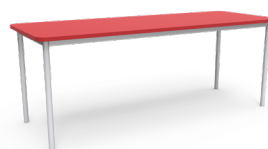
Mesa LP 200x75x75cms Esq. Rectas SKU: AP22 Esq. Redondeadas SKU: AP23 240x75x75cms Esq. Rectas SKU: AP24 Esq. Redondeadas SKU: AP25