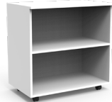
Gabinete abierto rodante SKU: AW95