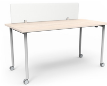
Mesa Link rodante con separador de vidrio 120x60x75 SKU: AV80 150x60x75 SKU: AV81 180x60x75 SKU: AV82