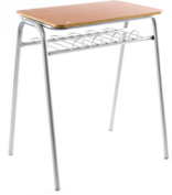
Formalita estándar N° 1 SKU: AA13