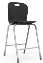
Class 65 cms SKU: AX06