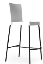
Valencia Tipo H SKU: AP50