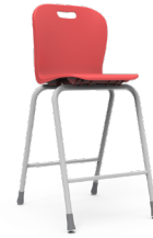
Class 75 cms SKU: AP64