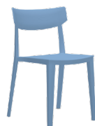
Rio SKU: AU78