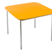
Mesa Kinder formalita SKU: AB05