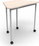
Trapezoidal moldeado Movi SKU: AS68