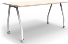
Ginebra 150x75x75 SKU: AS63