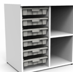
Gavetero Tidy 6 cajas estándar 1 repisa SKU: AX16