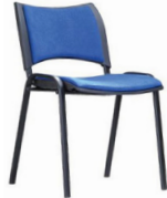
Iso Smart tapizada SKU: AP92