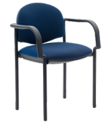
Confort tapizada con brazos SKU: AC01