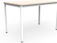
Paris Formalita 150x90x97cms SKU: AQ82 180x90x97cms SKU: AQ83