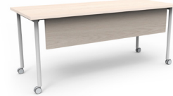
Mesa Link rodante con faldón laminado 120x60x75 SKU: AV83 150x75x75 SKU: AV84 180x75x75 SKU: AV85