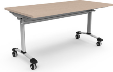
Michigan 150x75x75 SKU: AU30