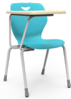
Pienza paleta Estándar SKU: AW22