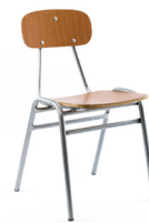
Formalita Estándar N° 1 SKU: AA03