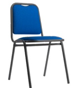
Super Nova tapiz lana SKU: AC55