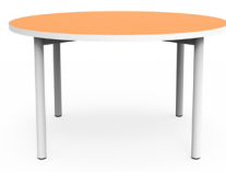
Chuby Small SKU: AW59