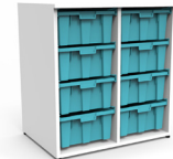
Gavetero Tidy 8 cajas estándar SKU: AX13