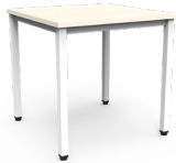
Mesa Paris 75x75x75cms SKU: AQ10 120x75x75cms SKU: AQ11