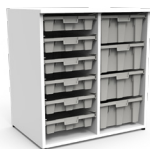
Gavetero Tidy 6 cajas estándar 4 cajas grandes SKU: AX14