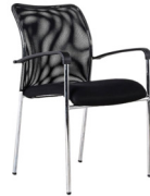
Strong Cód.: AP70