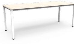
Mesa Paris 200x75x75cms SKU: AQ14 240x75x75cms SKU: AQ15