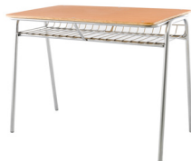
Mesa Profesor estándar Con parrilla SKU: AA19