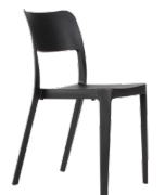
Vita SKU: AX11