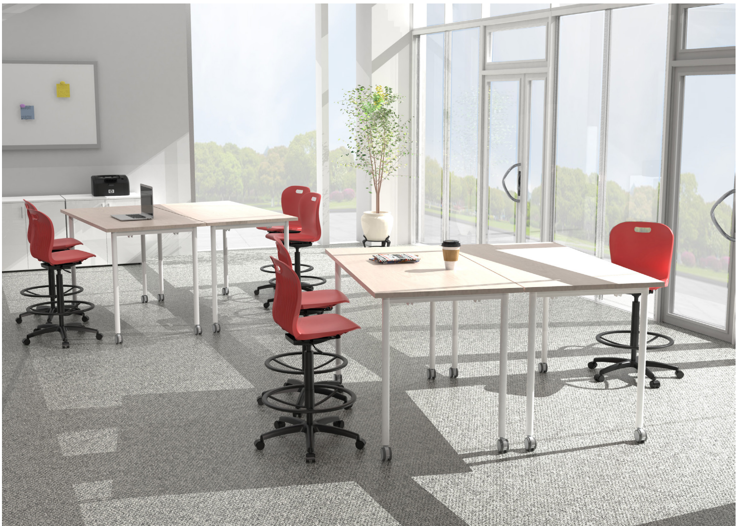
Ambiente laboratorio con mesas rodantes altas de las serie LINK y sillas altas giratorias de la serie CLASS.

Los educadores de hoy utilizan diferentes espacios para complementar el conocimiento impartido en las aulas. Una variedad de modos de enseñanza requiere de ambientes que motiven a los diversos estudiantes a involucrarse en los proyectos, con un énfasis más fuerte sobre el aprendizaje activo. Los laboratorios son parte de estos espacios para compartir conocimiento.