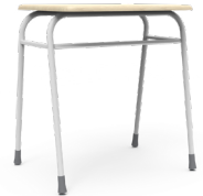
Class Tipo 5 Normado SKU: AR61