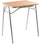
Formalita Mineduc Tipo 5 SKU: AA46