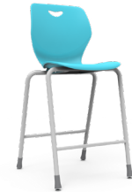
Pienza 65 cms SKU: AW21