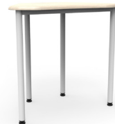
Trapezoidal Moldeado Tipo 5 SKU: AW03