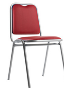
Super Nova tapiz tevinil SKU: AC53