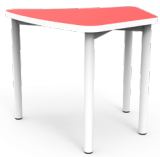
Pétalo Small SKU: AW58