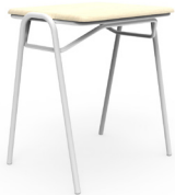
Superior Tipo 5 Normado SKU: AP10