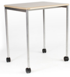
Moldeado Movi SKU: AS66