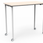
Mesa Link rodante alta 120x60x105 SKU: AV86 150x75x105 SKU: AV87 180x75x105 SKU: AV88