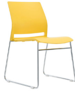
Vittoria SKU: AV54