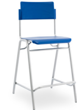
Ergosilla Cajera 75 cms SKU: AT46