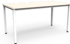
Mesa Paris 150x75x75cms SKU: AP53 180x75x75cms SKU: AQ13