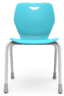
Pieza Tipo 5 SKU: AW10