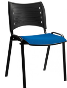
Iso Smart tapiz poli SKU: AP91