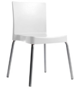
Valencia SKU: AN94