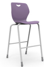
Pienza 75 cms SKU: AX05