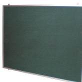
Cartelera 120x100 cms. SKU: AA95 60x90 cms. SKU: AA96