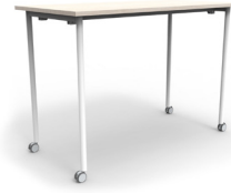
Virginia alta 150x75x105 SKU: AS64