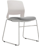
Berna SKU: AT95