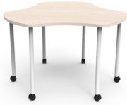
Trébol Movi SKU: AS65