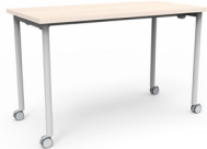
Mesa Link rodante 120x60x75 SKU: AV60 150x60x75 SKU: AV61 180x60x75 SKU: AV62