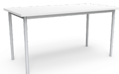
Mesa LP 150x75x75cms Esq. Rectas SKU: AP18 Esq. Redondeadas SKU: AP19 180x75x75cms Esq. Rectas SKU: AP20 Esq. Redondeadas SKU: AP21