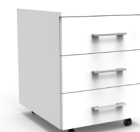
Cajonera Móvil 3 cajones SKU: PC44BL