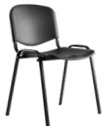
Isósceles polipropileno SKU: AB67