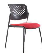
Alice asiento tapiz SKU: AQ16