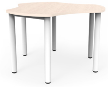
Trébol SKU: AR41