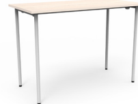
Mesa Link fija alta 120x60x105 SKU: AV75 150x75x105 SKU: AV76 180x75x105 SKU: AV72