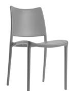
Todi SKU: AV05