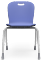
Class Tipo 5 SKU: AE31