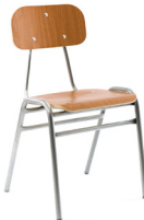
Formalita Mineduc Tipo 5 SKU: AA33