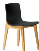
Niza SKU: PC05